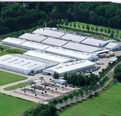
Werk Kunshan, China